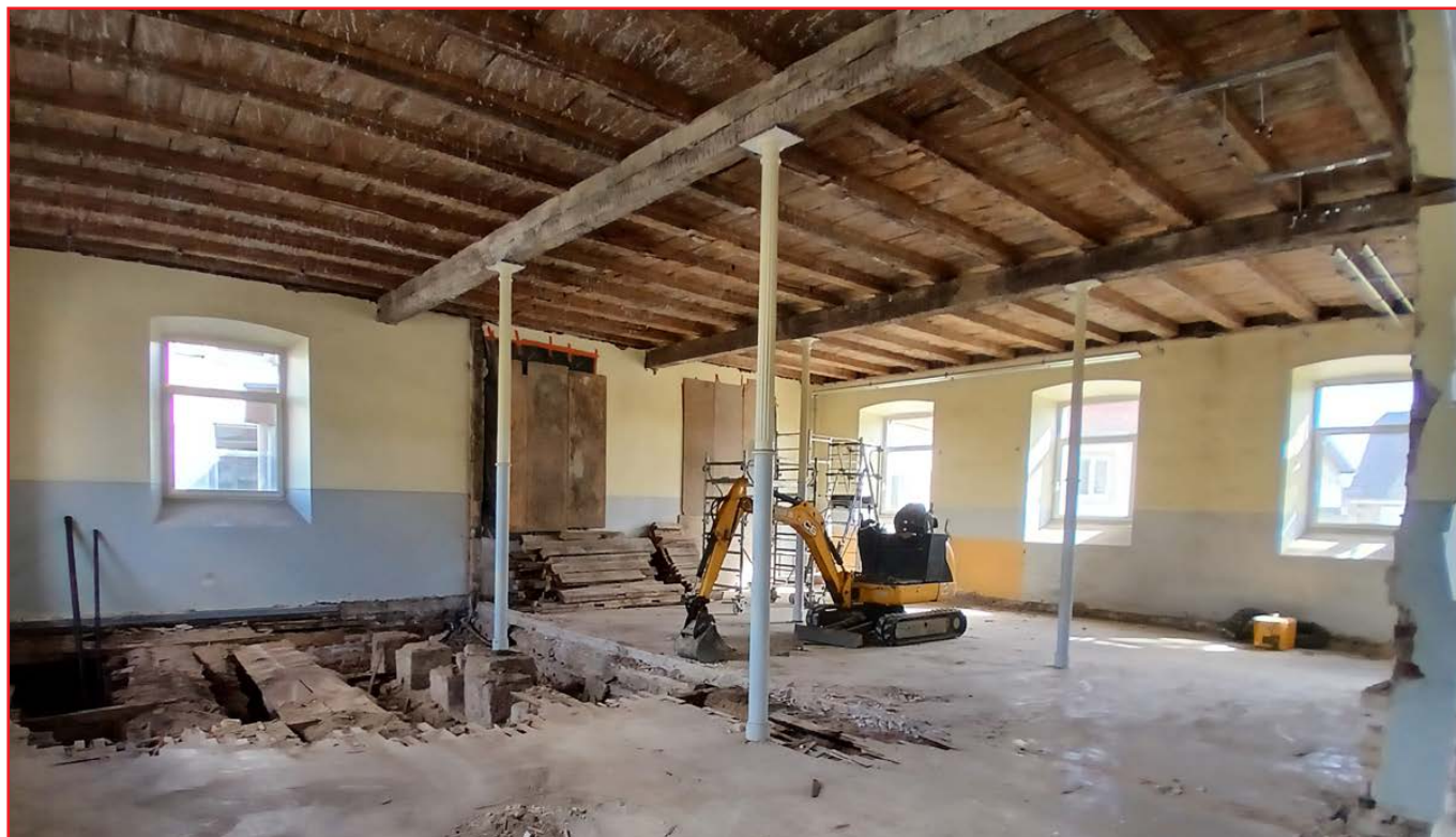
Étape de démolition indispensable avant réfection du sol

Les travaux de l'école élémentaire ont débuté la seconde quinzaine du mois d'août. Le chantier, qui durera encore plusieurs mois, a suivi une phase de déménagement du bâtiment.