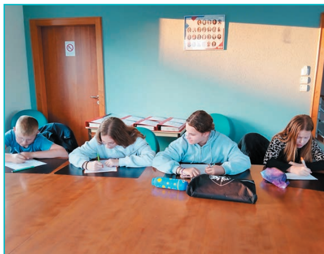
Une rencontre de clôture avant de passer le flambeau

Le CME élu en octobre 2023 vient d'achever son mandat. Des remerciements peuvent être adressés aux jeunes qui en ont fait partie. Outre leur participation aux commémorations, différentes actions ont pu être poursuivies (comme la chasse aux œufs), d'autres ont été ajustées (comme la collecte solidaire), tandis que des manifestations nouvelles sont apparues, en l'occurrence la Forêt de Noël et la projection cinématographique. N'oublions pas de remercier également les élus municipaux qui les ont encadrés.