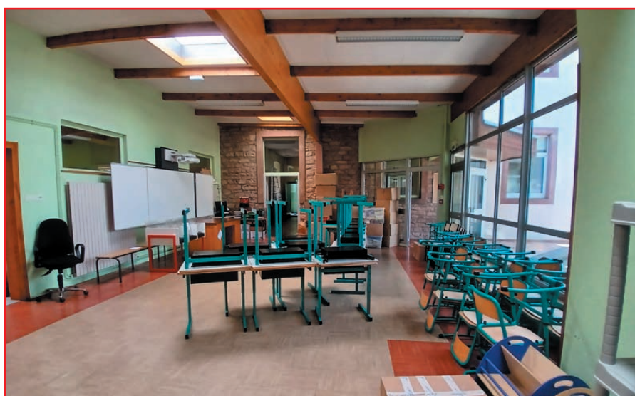
Préparation de la salle de classe des CE1 dans le hall de l'ancienne école maternelle

Dans le G'IM de décembre, un point sera fait sur l'avancement du chantier.