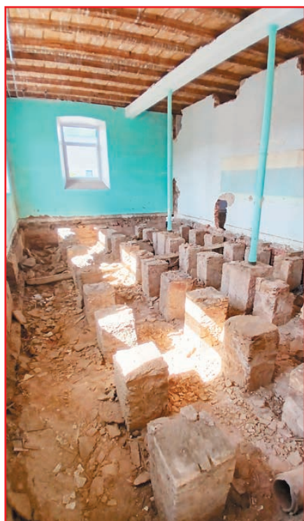
Le vide sanitaire sous le parquet d'une salle côté cour

été raccordée à la fibre optique afin que la connexion internet soit opérationnelle à la rentrée. Les ordinateurs des salles de classe