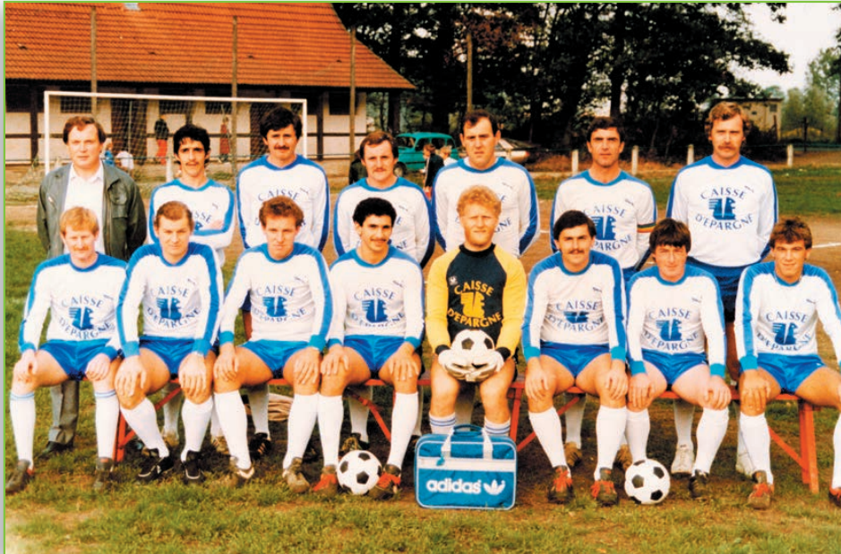
Montée en D1 en 1985

Le dimanche 17 août, le Football-Club de Geudertheim (FCG) a fêté ses 85 ans. En toute simplicité, les anciens du FCG, contents de se retrouver, accompagnés des dirigeants actuels, ont soufflé les 85 bougies autour du vin d'honneur offert par le club.