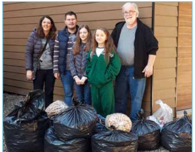
Les premiers bouchons donnés à l'association fin avril

Avec les autres CME la Communauté de communes de la Basse-Zorn (Bietlenheim, Gries, Hoerd, Weyersheim) nous sommes allés à Strasbourg visiter le Parlement Européen le 3 avril 2024. Nous avons vu à l'entrée du bâtiment et de nouveau à l'intérieur les 27 drapeaux des pays membres de l'Union européenne. On est entrés dans les tribunes de l'hémicycle où siègent les députés européens pour discuter et voter des lois de l'Union européenne appelées des directives. Cela était intéressant mais un peu court car certains lieux étaient en travaux.