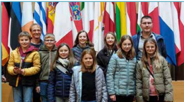
Photo officielle avec les personnalités du jour !

Avec les autres CME la Communauté de communes de la Basse-Zorn (Bietlenheim, Gries, Hoerd, Weyersheim) nous sommes allés à Strasbourg visiter le Parlement Européen le 3 avril 2024. Nous avons vu à l'entrée du bâtiment et de nouveau à l'intérieur les 27 drapeaux des pays membres de l'Union européenne. On est entrés dans les tribunes de l'hémicycle où siègent les députés européens pour discuter et voter des lois de l'Union européenne appelées des directives. Cela était intéressant mais un peu court car certains lieux étaient en travaux.