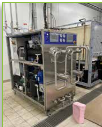
Les turbines de production de glaces.

La Maison Franchi ne se contente pas de répondre à la demande locale. Les projets futurs incluent le développement d'une franchise, permettant à des partenaires de bénéficier de l'expertise et du savoir-faire de Franchi et Technicaf. L'objectif ultime est clair : devenir le leader en Alsace et le troisième fabricant de glace artisanale en France. « Nous voulons marcher sur les traces de mon grand-père qui a traversé les