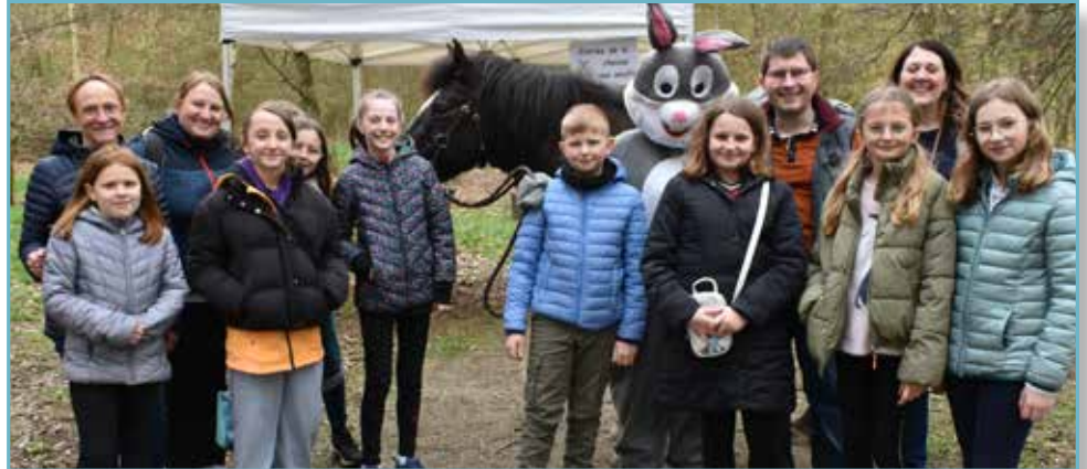
Le lapin et son cheval avec le CME et des encadrants

Cette page relate l'actualité du conseil municipal des enfants, élu en octobre 2023. Ils présentent eux-mêmes leurs activités du trimestre écoulé.