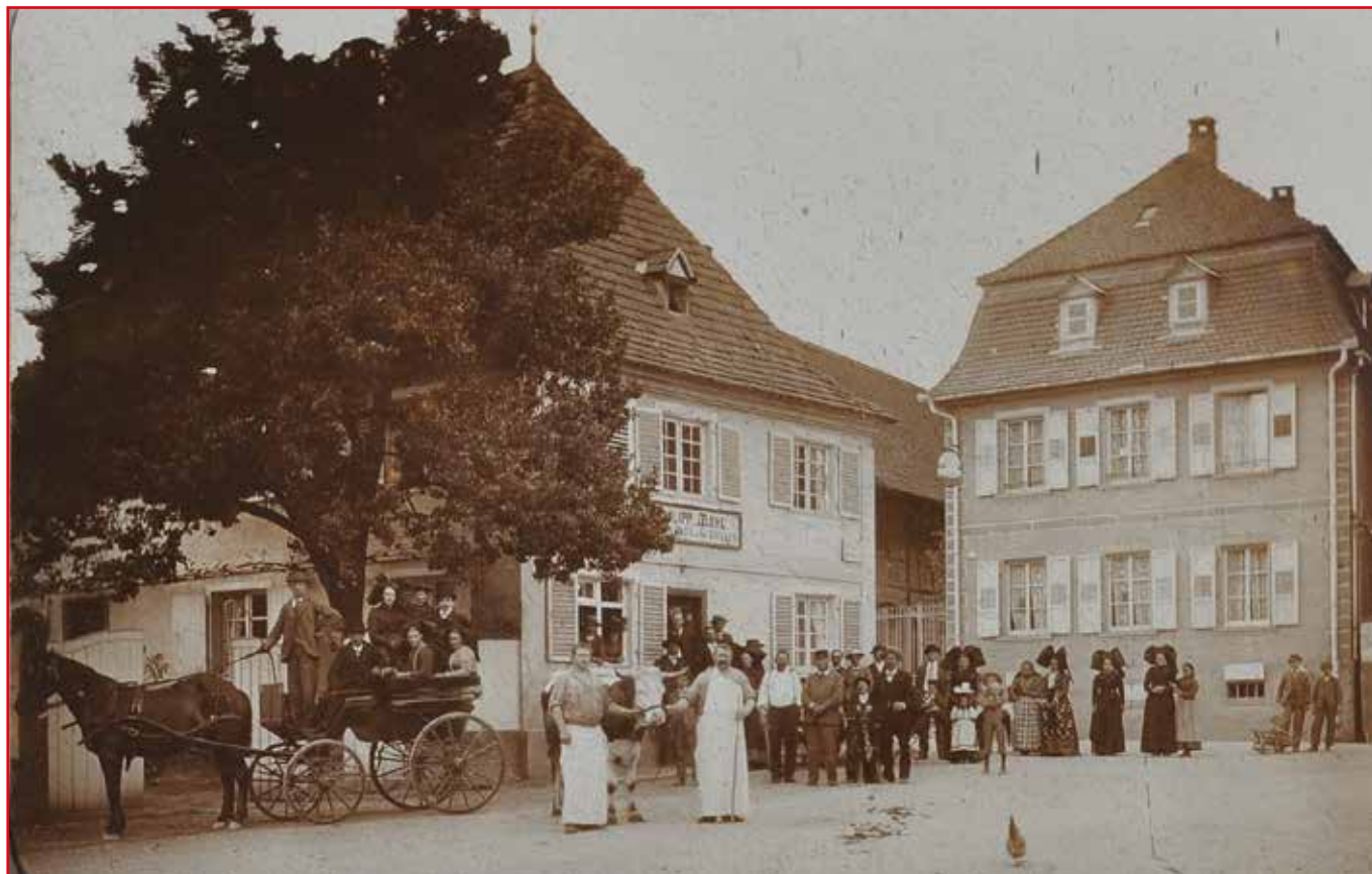
Des villageois posent devant la Wirtschaft zum Schwanen au début du siècle dernier.

Après plusieurs semaines de fermeture, le restaurant Au Cygne, situé au croisement de la rue du Général de Gaulle et de la route de Bietlenheim, a rouvert ses portes. C'est l'occasion de revenir sur l'histoire de cet établissement et du terrain qu'il occupe.