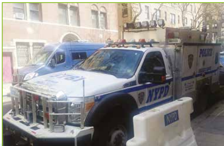
Un véhicule d'intervention de l' Emergency Service Unit

Nous avons été accueillis au poste de police du 13 e district où le travail de terrain de l' Emergency Service Unit nous a été expliqué. Cette unité d'élite proche du SWAT ( Special Weapons And Tactics , armes et tactiques spéciales), équivalent de notre RAID, intervient sur des situations extrêmes comme les tueries de masse, catastrophes naturelles ou autres accidents graves. Le matériel de l'impressionnant véhicule d'intervention nous a été présenté. Chaque véhicule de cette unité porte le nom d'un policier décédé lors des attentats du 11 septembre 2001.