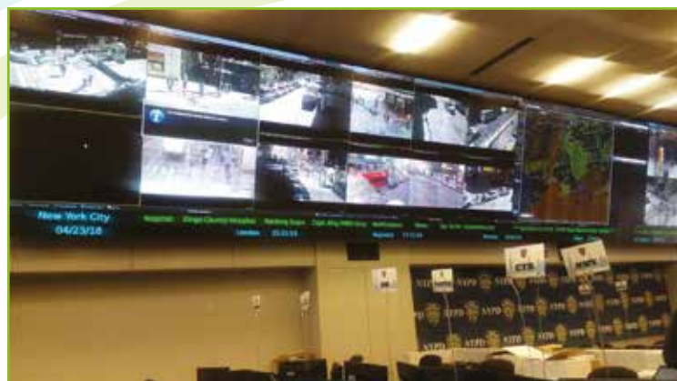
Le centre de commandement de One Police Plaza

Nous avons terminé notre voyage vers Washington, D.C. par la visite de sites tels le Capitole, siège du Congrès, le mémorial d'Abraham Lincoln, la Maison Blanche et le Pentagone (ministère de la Défense). New York reste une ville exceptionnelle du fait de sa grandeur, son activité, ses sites. On ne peut pas rester insensible à ce gigantisme même si j'étais heureux de retrouver le calme de ma paisible commune de Geudertheim. »