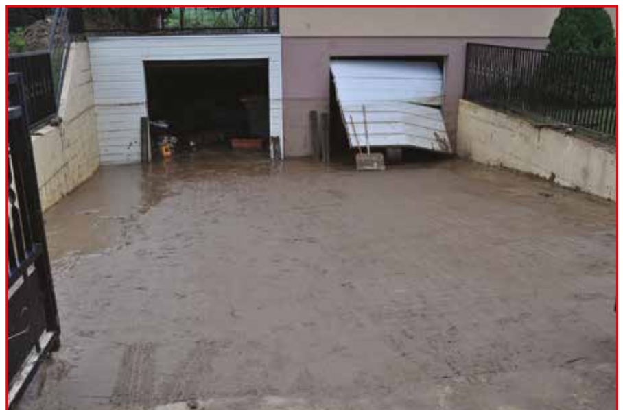
Maison inondée rue des Lilas