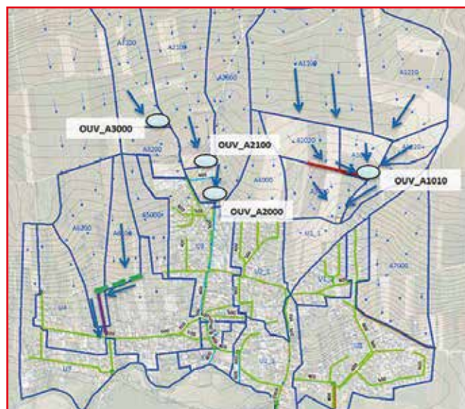
Localisation des ouvrages de rétention sur le ban communal de Geudertheim, Anteagroup 2014

L'ouvrage A2000 a été réalisé en 2016 par la commune. Aujourd'hui, les travaux proposés sont estimés à environ 700 000 € pour une protection de retour 100 ans.