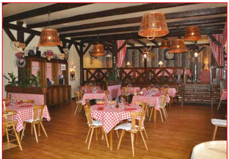
la grande salle du restaurant en juin 2018, après quelques travaux de rafraîchissement.

À l'époque où l'actuelle salle polyvalente n'existe pas encore, la grande salle sert pour les bals et, en alternance avec d'autres restaurants, pour les concerts d'hiver de la Musique Paysanne : notamment en 1932, 1946, 1952, puis sans interruption de 1954 à 1968. Le programme du 12 février 1955 mentionne d'ailleurs que le concert a lieu « dans la grande salle rénovée du restaurant ». Le groupe folklorique y répète parfois la fameuse Danse des Moissonneurs , qui nécessite beaucoup de place, car elle s'exécute avec des râtaux et des faux. C'est également dans les dépendances du restaurant que s'entraînent les sportifs de la société de gymnastique Alsatia, aujourd'hui disparue.