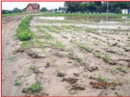
Photo de l'emplacement du futur bassin A3000 - CAA 2018

La commune a intégré le Programme d'Actions de Prévention des Inondations (PAPI) Zorn Aval et Landgraben, qui permet de bénéficier de 50 % d'aide du fonds Barnier pour la réalisation de ces ouvrages.