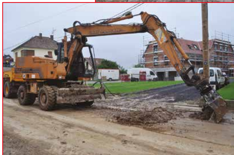
Enlèvement de la boue rue de l'Arche.