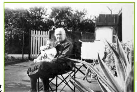
Quel est cet enfant sur les genoux de la sage-femme ?

Ce n'est qu'en 1982 que la profession s'ouvre aux deux sexes. Sage-femme est toléré au masculin mais on préfère dire accoucheur.